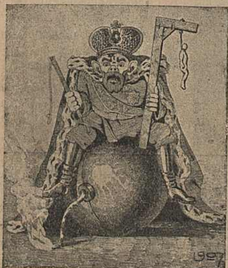
Карыкат. № 5.

акоўвалі асуджаных; з аднаго боку „святый отче Столыпине“ з сякерай ката, з другога боку „святый отче Побѣдоносцевъ“ з шыбеніцай. Зверху і ўнізе галовы паліцэйскіх з крылышкамі на падобіе анёлаў. Усе гэтыя дэталі агулам узятыя вельмі характэрны для кругабегу царавання Міколы II.