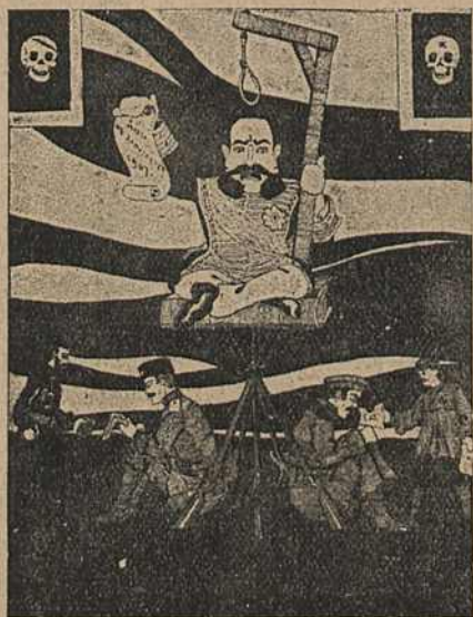
Карыкат. № 11.

На карыкатуры № 11 на штыках ружэй салдатаў сядзіць