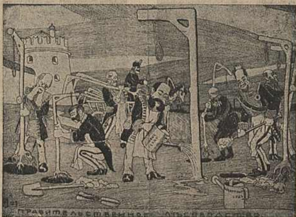
Карыкат. № 21.

Карыкатура № 21 мае надпіс: „Правительственное льсо-