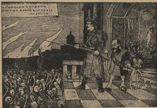
Карыкат. № 25.

На карыкатуры № 25 шкілеты падступаюць пад царскі дварэц. Сталыпін штурхае салдата на абарону цара, якога ён