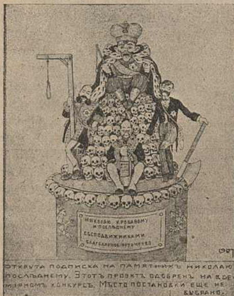
Карыкат. № 3.

Цыкль сатырычных карыкатур на б. цара Міколу II пачынаецца помнікам (№ 3). На кучы чалавечых чарапоў сядзіць Мікола II, які ў правай руцэ трымае бізун, а левай паказвае хвігу. Чарапы з трох бакоў падпіраюць тры слупы манархізму: Віттэ, Сталыпін і Дурнаво. Віттэ сядзіць сьпераду, трымаючы