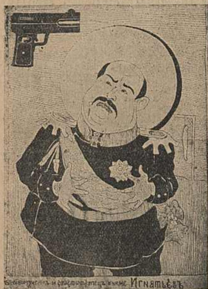
Карыкат. № 18.

Карыкатуры №№ 18-19 разьвіваюць адну ідэю: Ігнацьцеў, а перад ім браўнінг (гл. № 14); на № 19 зверху Пабеданосцаў.