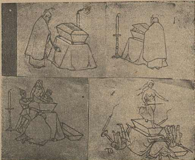
Карыкат. № 2.

Карыкатура № 2 складаецца з чатырох частак, якія зьяўляюцца паступовай распрацоўкай пахавання царскім ражымам Вольнасьці. На першым малюнку поп „адпявае“ задушаную ў труне Вольнасьць; на другім—Вольнасьць робіць