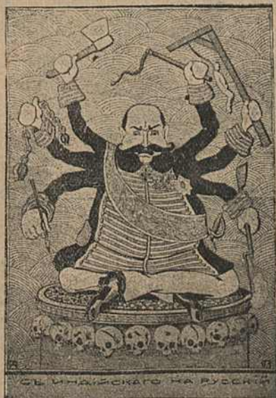
Карыкат. № 12.

На карыкатуры № 12 Сталыпін сядзіць на падобіе індыйскага мага з шасьцю рукамі, у якіх трымае розныя арудзія барацьбы з рэвалюцыяй; мейсца, на якім ён сядзіць, убрана чалавечымі чарапамі, частка якіх расьсечана шашкамі, а частка прабіта кулямі. Надпіс: „Сь індыйскага на рускій“.