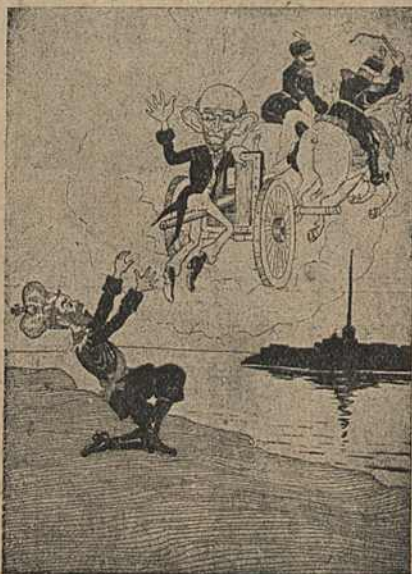
Карыкат. № 17

На карыкатуры № 17 жандармы, пасадзіўшы Пабеданосцава на пушку, жывым вязуць яго на неба. У агульнай ідэі,