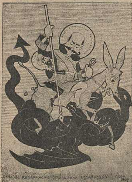
Карыкат. № 13.

Карыкатура № 13 мае надпіс: „Святое изображение Столыпина бѣдоносца—лѣта 1907“. Сталыпін з карыкатурнымі дэталлямі намалёван на падобіе абраза Георгія Пабеданосца; ззаду за яго трымаецца маленькая, ніштожная, дзіцячая, страшэнна перапужаная фігура б. цара Міколы II. Акалічнасьць паказвае, што ў часе рэакцыі пасля першае рэвалюцыі цар трымаўся толькі дзякуючы рэпрэсіям Сталыпіна. Яго галава ў