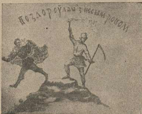
Карыкат. № 1.

Карыкатура № 1 мае зверху надпіс: „Поздорѹляю з Новым Роком“. Новы 1907 г. у вобразе беларускага селяніна