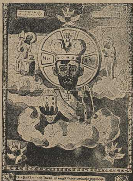
Карыкат. № 4.

На карыкатуры № 4 „Св. новоявленная ікона Ніколая Петергофскаго чудотворца“ дан партрэт Міколы II у стылю абразоў праваслаўнае царквы. У правай руцэ Міколы II крэпасная вежа, куды садзілі рэвалюцыянераў, у левай — нагайка з ланцугамі, якімі