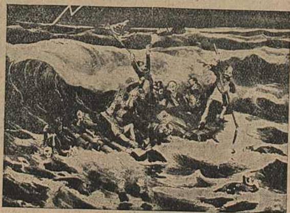
Карыкат. № 24.

тоне сярод хваль бушуючага мора—рэвалюцыі. Першай па часу распрацоўкі зьяўляецца карыкатура № 23, апошняя—№ 24, з прычыны таго, што на першай вялікае нагромаджэньне фігур,