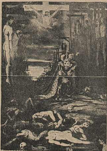
Карыкат. № 8.

жэту знаходзім у часопісу „Буреломъ“, 1905, № 1, дзе на стар. 1 Вітта сядзіць на кучы бомбаў.