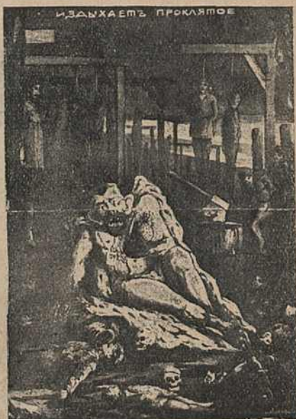
Карыкат. № 7.

жэту знаходзім у часопісу „Буреломъ“, 1905, № 1, дзе на стар. 1 Вітта сядзіць на кучы бомбаў.