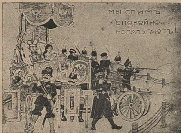
Карыкат. № 9.

Карыкатура № 9 „Мы спімь спакойно... не запугаюць!..“ звязаная в вядомымі словамі Сталыпіна, якія былі сказаны ў адносінах да рэвалюцыянэраў,—дае ложка Міколы II, бы-