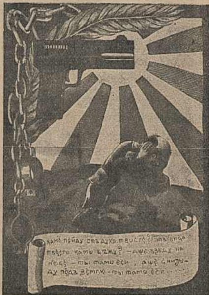
Карыкат. № 14.

кругу сьвятога, на якім надпіс: „Отче Столыпіне чудотворецъ“. Сюжэт Георгія Пабеданосца ў політычнай карыкатуры выкарыстоўваўся раней „Волшебнымъ Фонаремъ“, 1906, № 4, дзе на стар. 12 чырвоная „Свобода“ паражае дракона. Надпіс „Бѣданосцевъ“ (падобны да „бѣданосецъ“) раней сустракаўся ў адносінах да Пабеданосцава (гл. час. „Нагаечка“, 1905, № 3, стар. 3).