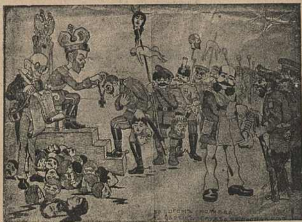
Карыкат. № 22.

Карыкатура № 22 падпісана: „За богом—молитва, за царем—служба не пропадает!“ Цар раздае ўзнагароды паліцы за падаўленьне паўстаньня проці яго, тут жа Пабеданосцаў задаволены запісвае імёны гэрояў рэакцыі... каля ног яго