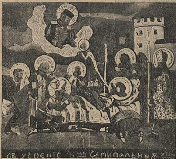
Карыкат. № 16.

дата ззаду трымаецца Стальпін, а за апошняга б. цар Мікола II з дзіцячымі цацкамі. Абудвы, хаваючыся за сьпіну жаўнера, паказваюць селяніну хвігі.