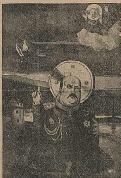
Карыкат. № 19.

На агульны царскі строй Ружанцоў пакінуў сем карыкатур.