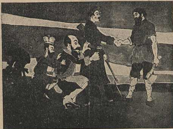
Карыкат. № 15.

усе тры нумары зьяўляюцца распрацоўкай аднаго сюжэту. Нешта напамінаючае гэты сюжэт знаходзім у часопісу „Пламя“, 1905, № 3, дзе на стар. 3—галава міністра Дурнаво, а на яе накіраван браўнінг; у часопісу „Буреваль“, 1906, № 1, на стар. 7 — чортападобная ляжачая фігура ў паліцэйскай шапкі, над галавой шашка, а ўнізе надпіс: „Камо пойдуча ад духа твоего і ад тваёй тваёй камо б’жу“.