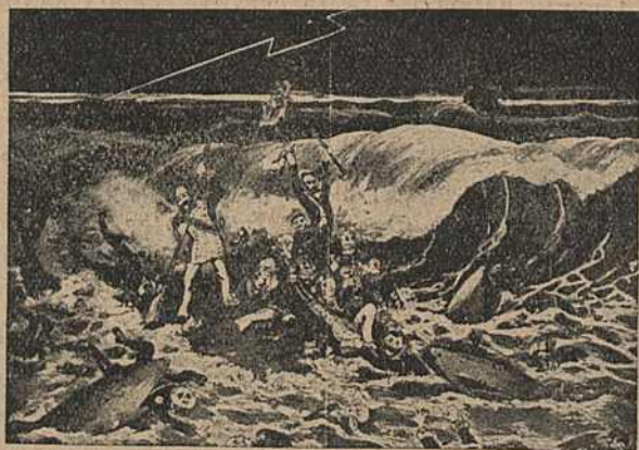
Карыкат. № 23.

Карыкатуры №№ 23—24 зьяўляюцца распрацоўкай сюжэту гібнучага монархізму; плот з галаўнейшымі прадстаўнікамі царызму, які знаходзіцца пад кіраўніцтвам Сталыпіна,