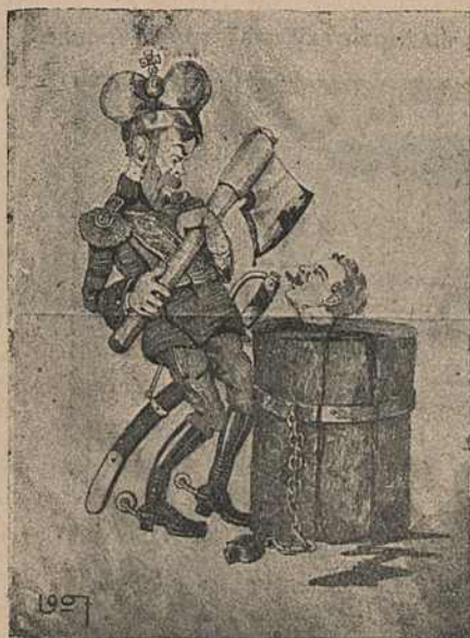
Карыкат. № 6.