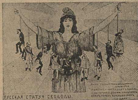
Карыкат. № 20.

На карыкатуры № 20 „Русская статуя свободы“—пры-