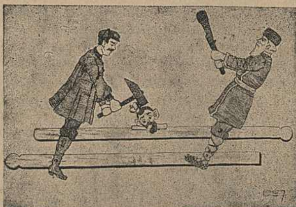
Карыкат. № 10.

Адносна карыкатуры № 10 гаварылася раней.